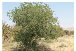
Pistachier de l’Atlas