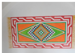
Le tapis berbère (Ecomusée de Bouhedma)