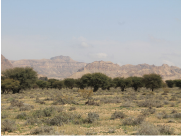
شبه السافانا المكونة من أشجار الطلح ( Acacia raddiana )

تتميز الحديقة الوطنية بيوهدمة بجمالية مشاهدها الطبيعية النابعة من تناسق واتزان خصائصها الطبيعية التي تمزج بين الطابع الجبلي للمرتفعات التي تحد الحديقة شمالا، والسهول العشبية التي تطل على منخفضات شاسعة تجمع بين امتداد السبخة وانتصاب جبال الأطلس الصحراوي في الأفق البعيد.