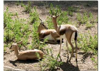
La gazelle mhorh introduite dans le Parc National de Bouhedma