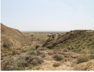
جمالية المشاهد الطبيعية بالحديقة

تتميز الحديقة الوطنية بيوهدمة بجمالية مشاهدها الطبيعية النابعة من تناسق واتزان خصائصها الطبيعية التي تمزج بين الطابع الجبلي للمرتفعات التي تحد الحديقة شمالا، والسهول العشبية التي تطل على منخفضات شاسعة تجمع بين امتداد السبخة وانتصاب جبال الأطلس الصحراوي في الأفق البعيد.