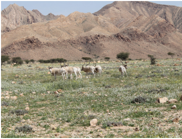
غزال أبي حراب: من الأنواع التي تم إعادة إدخالها إلى الحديقة

وقد ساهمت هذه الميزة في إحداث منظومة مروج عشبية تشبه منظومات السافانا" تعتبر فريدة من نوعها بتونس.