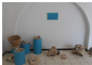
Monuments témoignant de la présence de l'Homme depuis l'ère préhistorique

Le Parc National de Bouhedma offre à son visiteur la découverte d'une panoplie de produits de terroir dont principalement :