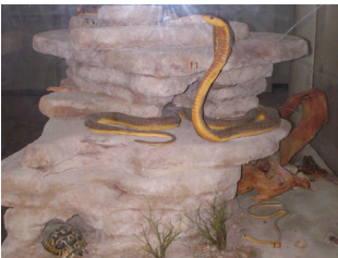
الكوبرا المصرية بالمتحف الإيكولوجي ببوهمة

كما يمكن للزائر مشاهدة عدد من الطيور من أهمها الصفارية ( Oriolus oriolus ) وقبرة الحقول ( Alauda arvensis ) والحميراء ( Phoenicurus moussieri ) والحسون الذهبي ( Carduelis carduelis ) والكناري البري ( Serinus serinus ) والدجاج الحبشي ( Numida meleagris ) والعقاب الحر ( Falco tinnuculatus ) والموسق ( Aquila chrysaetos ) وبومة الصدى ( Athene noctua ).