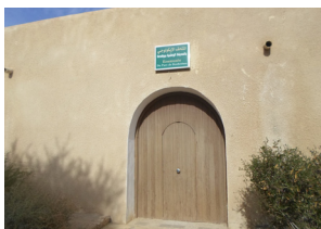
Ecomusée de Bouhedma