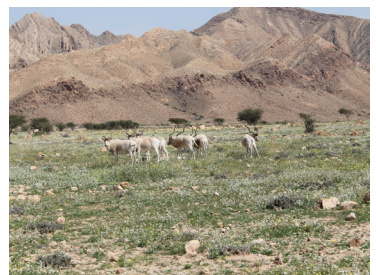
l'Addax: espèce réintroduite dans le Parc