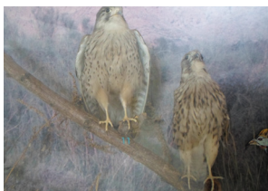
L'Aigle Royal dans l'écomusée de Bouhedma