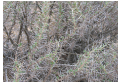
نباتات القطاط أو الاستراقال