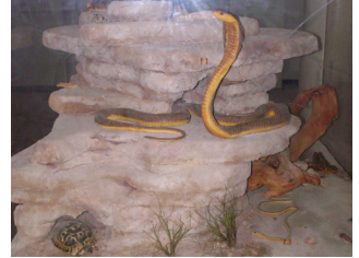
Cobra d’Egypte ( Naja haje ) dans l’écomusée de Bouhedma

Les premiers exemplaires d’Autruche à cou bleu ont été élevés au Parc de Bouhedma et dans la réserve d’Orbata. Ce n’est qu’en 2008 qu’ont été importés du Maroc 20 individus d’autruche à cou rouge qui ont été distribués entre la réserve d’Orbata, le Parc de Bouhedma et le parc de Jbil, pour fonder de nouvelles populations d’autruches locales.