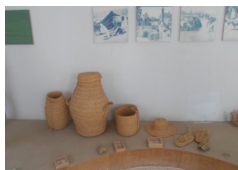
Produits artisanaux (écomusée de Bouhedma)