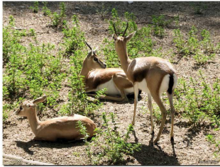
غزال المهمر ( Gazella dama mhorr )

وتتواجد بالمرتفعات الجرداء عديد الأصناف الحيوانية على غرار الأروية المغربية والقوندي والعقاب الحر. وتتواجد بسفوح المرتفعات والسهول أصناف أخرى من الثدييات على غرار غزال الدوركاس ( Gazella dorcas ) والأروية المغربية ( Ammotragus lervia ) وابن آوى ( Canis aureus ) والضبع ( Hyaena hyaena ).