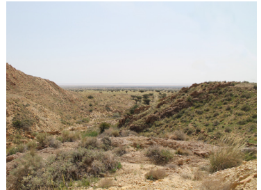
Beauté du paysage naturel du Parc

En plus de l'originalité de son paysage, le Parc National de Bouhedma a été lieu de réintroduction de plusieurs espèces de mammifères disparues pendant le dernier siècle comme les Antilopes Addax ( Addax nasomaculatus ), l'Oryx ( Oryx dammah ), le mouflon à manchettes ( Ammotragus lervia ), ou encore la Gazelle mhor ( Gazella dama mhor )