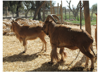
Enclos des mouflons à manchettes dans le Parc National de Bouhedma

Egalement, le visiteur du Parc peut observer plusieurs espèces d'oiseaux migrateurs ou sédentaires dont notamment: le Lorient d'Europe ( Oriolus oriolus ), l'Alouette des champs ( Alauda arvensis ), la Rougequeue de Moussier ( Phoenicurus moussieri ), le Chardonneret élégant ( Carduelis carduelis ), le Serin cini ( Serinus serinus ), la Pintade de Numidie ( Numida meleagris ), l'Aigle Royal ( Aquila chrysaetos ), le Faucon Crécerelle ( Falco tinnunculus ) et la Chouette Chevêche ( Athene noctua )